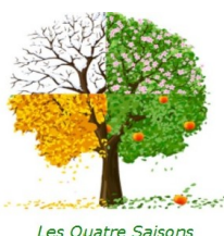
Les Quatre Saisons